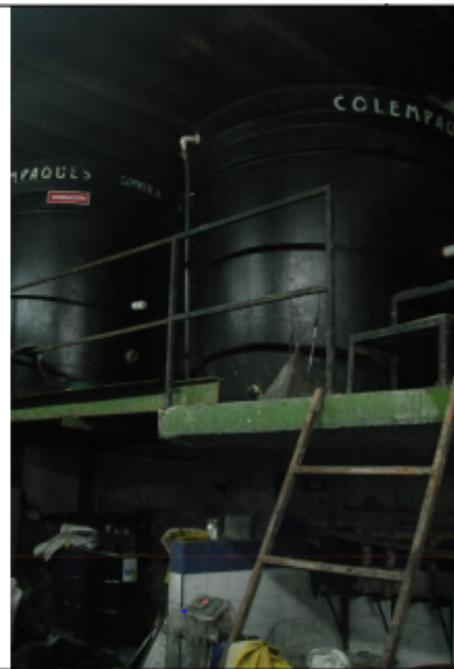
Foto No. 3 y 4. Sistema de tratamiento de aguas residuales producto del proceso