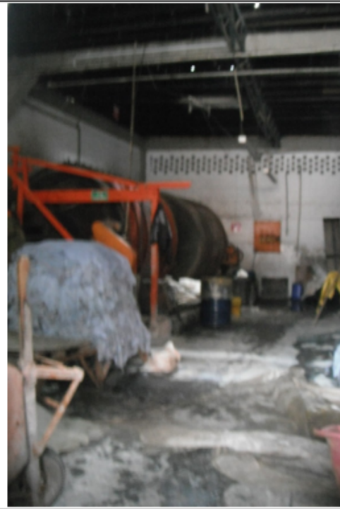
Foto No. 2 Proceso de curtación de pieles