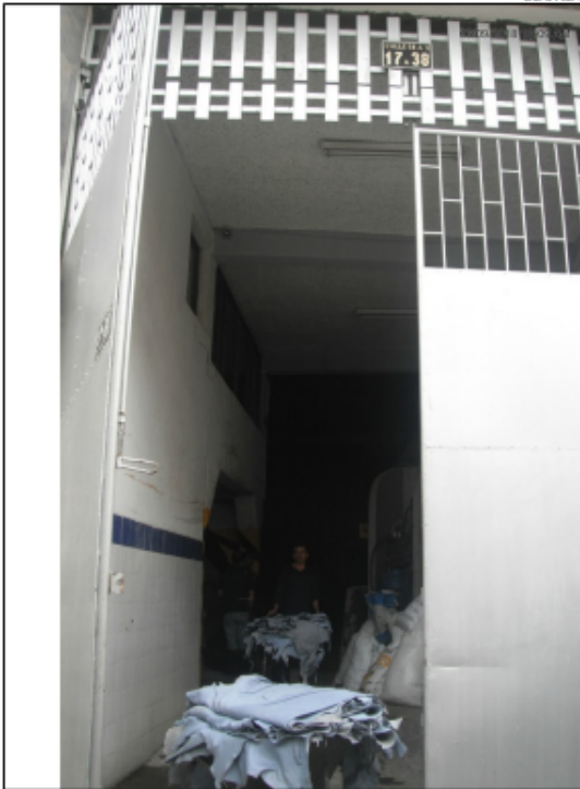
Foto No. 1 Fachada del establecimiento